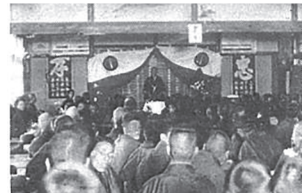
新校舎落成祝賀式典